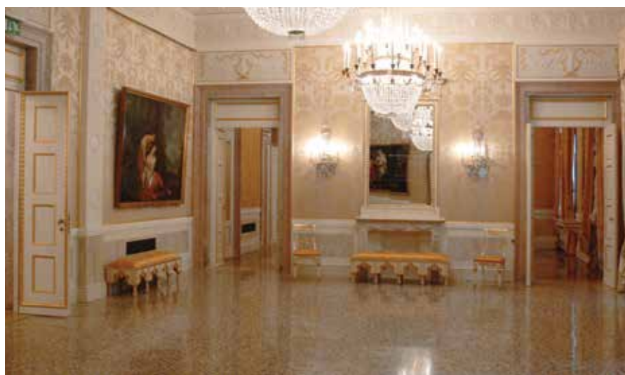
Foyer at Teatro La Fenice

Auguriamo a tutti Voi una visita piacevole e produttiva nella Serenissima.